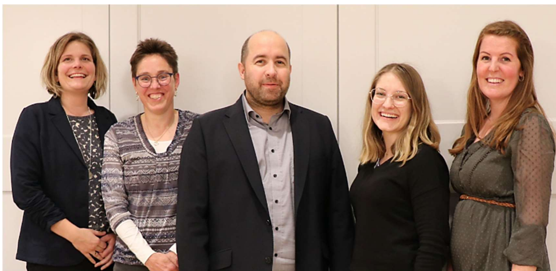
Commission de formation dès 2023

Le AuKo empruntera lui aussi de nouvelles voies à partir de l'année prochaine. A partir du 1.1.2023, le AuKo se présentera comme suit :