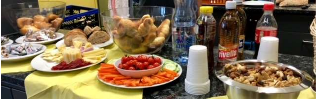
Fête de diplôme du 15.12.22 à Ittigen