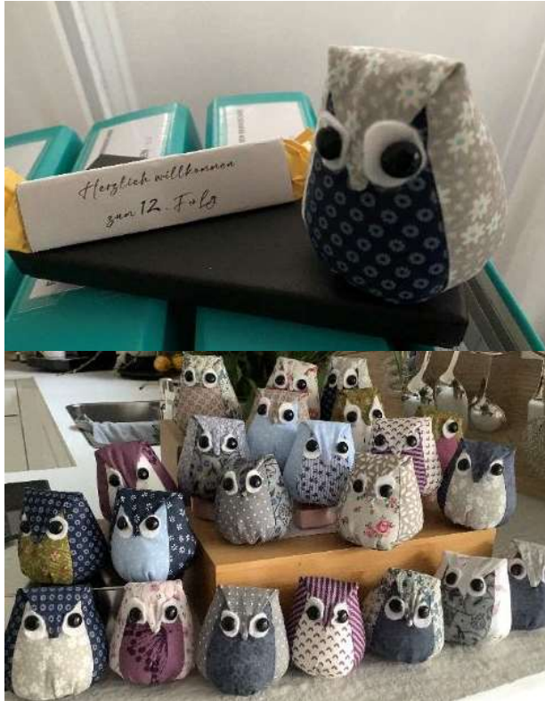
Matinée d'examen du 22.10.22 à Ostermundigen